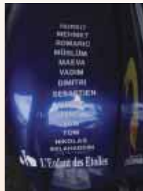
A chaque course, les prénoms des enfants figurent sur la voiture. Photo prise lors de la course à Zolder le 21/05/06

Corvette et BMW se côtoient dans un rutillement de couleurs. Les yeux ébahis, la bouche ne laissant échapper que des "ouah!" des "ouftis!" ou encore des "ça déchire...", nos gamins prennent contact, tout au fond du circuit, avec l'équipe. Et dès leur descente de voiture, Eric Lucas les accueille comme s'il les connaissait depuis des lustres. Martin part tout de suite pour sa première course de la journée et nous tous, supporters de toujours ou d'un jour, nous courons pour nous installer sur la terrasse dominant les stands, terrasse permettant de voir un bon tiers du circuit et tout au long de ces 20 minutes de course, nos gamins passeront en sprintant de l'avant de la terrasse à l'arrière pour apercevoir leur voiture bleue et jaune. Martin Lucas leur a offert, ainsi qu'à tous les spectateurs présents, une course de toute beauté, passant et re-dépassant ses concurrents, au-dessus ou en dessous, à gauche et à droite en même temps, les poussant, se faisant coincer contre le mur par un indélicat... Qu'à cela ne tienne: il gagne! Imaginez le sourire édenté du grand échalas et ceux des deux frangins, fiers comme un bar tabac! Au bout des deux autres manches, plus personne n'a de voix et Eric et son épouse sont trempés comme s'ils avaient fait le marathon de Paris en caisse à savon. Bref, on est les meilleurs!