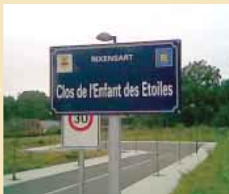
Un Clos étoilé qui n'attend plus que ses maisons...

Les éditions DUPUIS nous font un énorme cadeau! 10 pages spéciales "L'Anneau de Sémiramis", dans le numéro SPIROU du 20 septembre 2006.