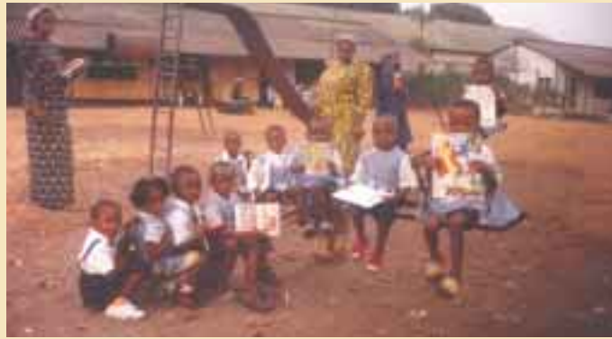
Des livres au Congo... pour le plaisir de lire, des petits et des grands, grâce au Commègè Cardinal Mercier.