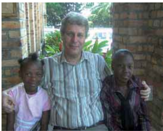
Revely et Galilée sourient à leurs parrains belges...