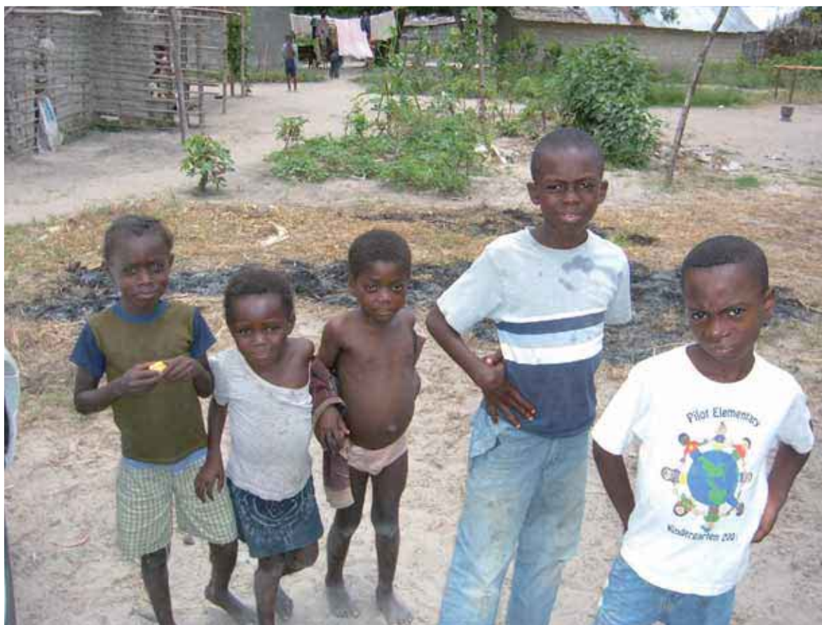
Des enfants trop vite seuls dans la vie...

Les extrapolations nous font penser que l'on comptera 25 millions d'orphelins du SIDA d'ici 2025.