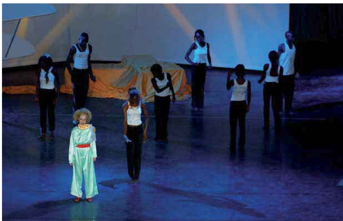
Le Petit Prince au Palais du Peuple de Kinshasa

En 2003, à l'initiative du Gouvernement belge des Ministres des Affaires étrangères Louis MICHEL et de la Défense André FLAHAUT, L'Enfant des Etoiles interprétait à Kinshasa " Le Petit Prince " adapté en comédie musicale, mêlant sur scène et lors de plusieurs minirécitals enfants congolais et belges. C'était le prétexte à des échanges culturels et à des rencontres dont en particulier avec les enfants de la rue, tandis que les soutes de l'avion militaire étaient remplies de colis de première nécessité.