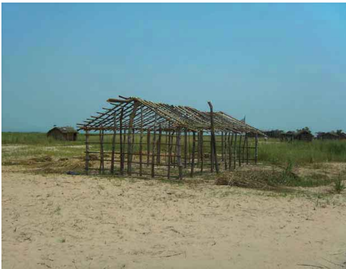
L'actuelle école de Lukunga...

L'achat d'un moulin à grains, la construction d'écoles en matériau durable et sur pilotis (il arrive en effet que les îles soient, durant les moments de crue du fleuve, pratiquement totalement immergées) et des groupes électrogènes figurent dans les priorités.