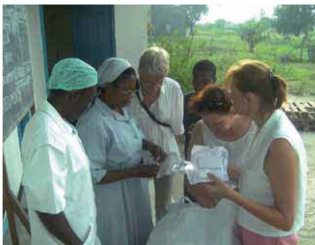
Remise du matériel médical récolté en Belgique

Outre la poursuite du programme d'équipement, L'Enfant des Etoiles va s'attacher à assurer le raccordement électrique du dispensaire.