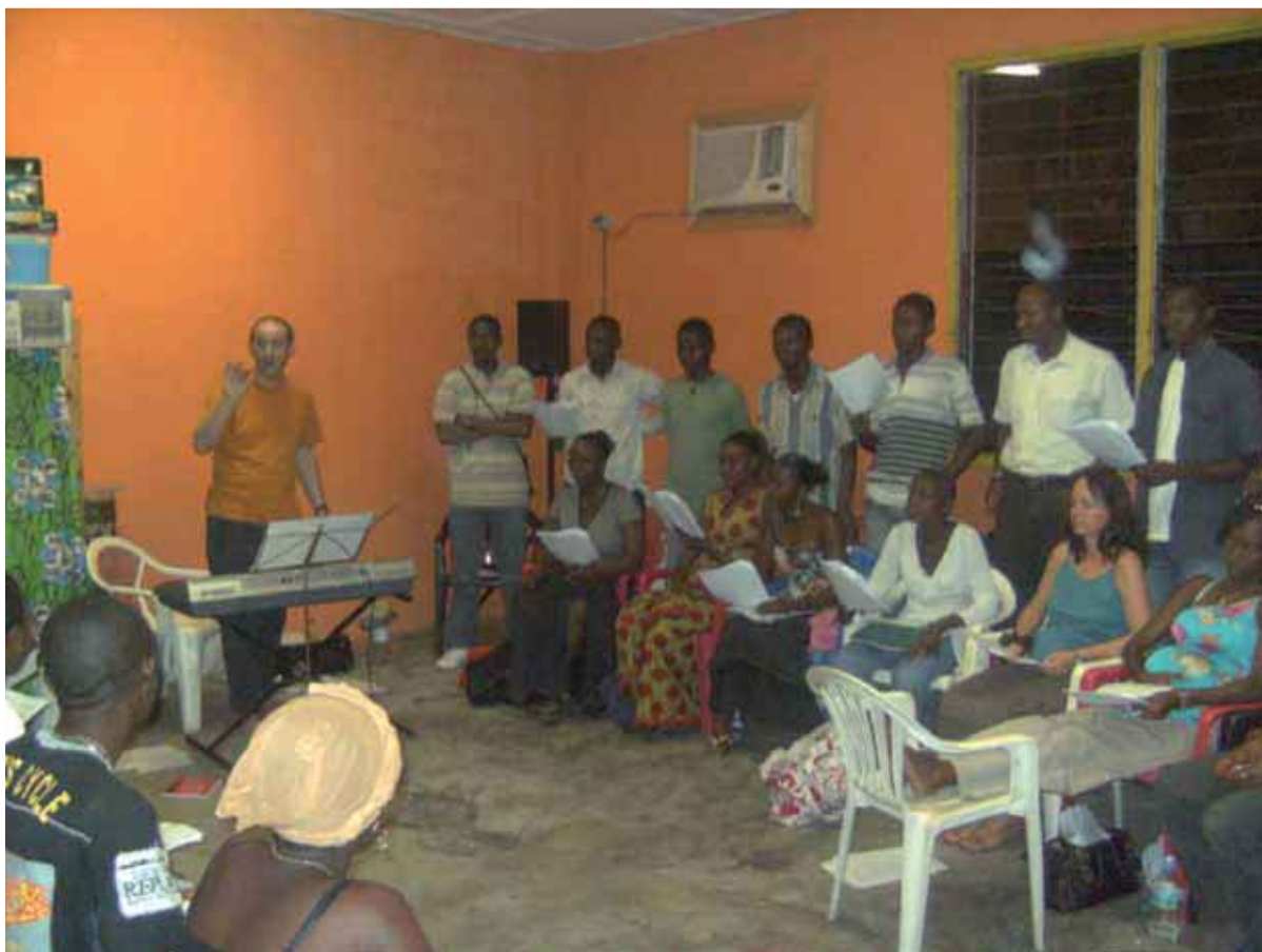
La chorale des En-Chanteurs en pleine répétition

Ce sont avant tout les jeunes qui peuvent briser la loi du silence qui accompagne trop souvent ce fléau qui doivent être touchés. Pour cela, il faut leur donner une information correcte et les moyens d'agir.