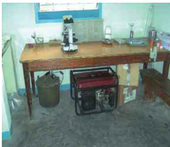
Le nouveau groupe électrogène