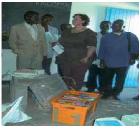
L'Opération « Crayons de couleur » est un succès !