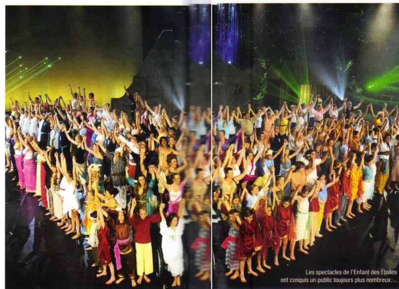
Les spectacles de l'Enfant des Étoiles ont conquis un public toujours plus nombreux...